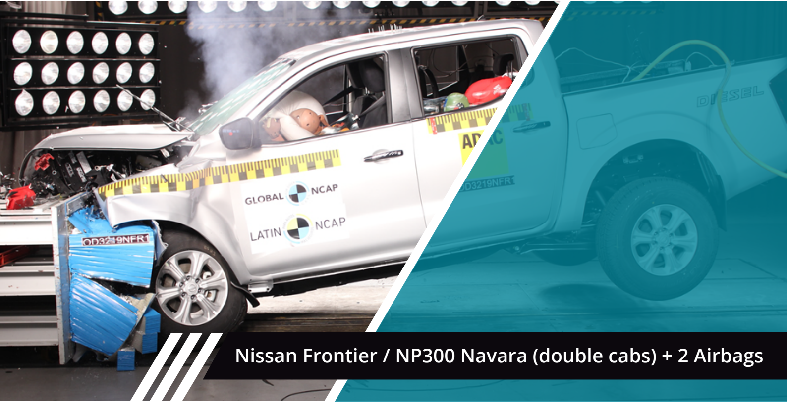
Nissan Frontier / NP300 Navara (double cabs) + 2 Airbags