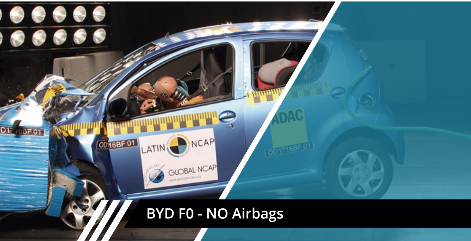
BYD F0 - NO Airbags