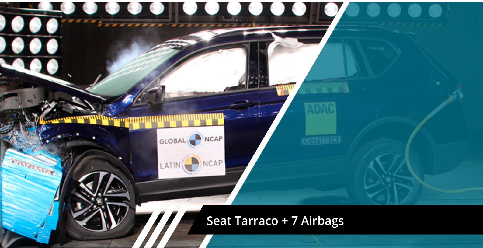
Seat Tarraco + 7 Airbags