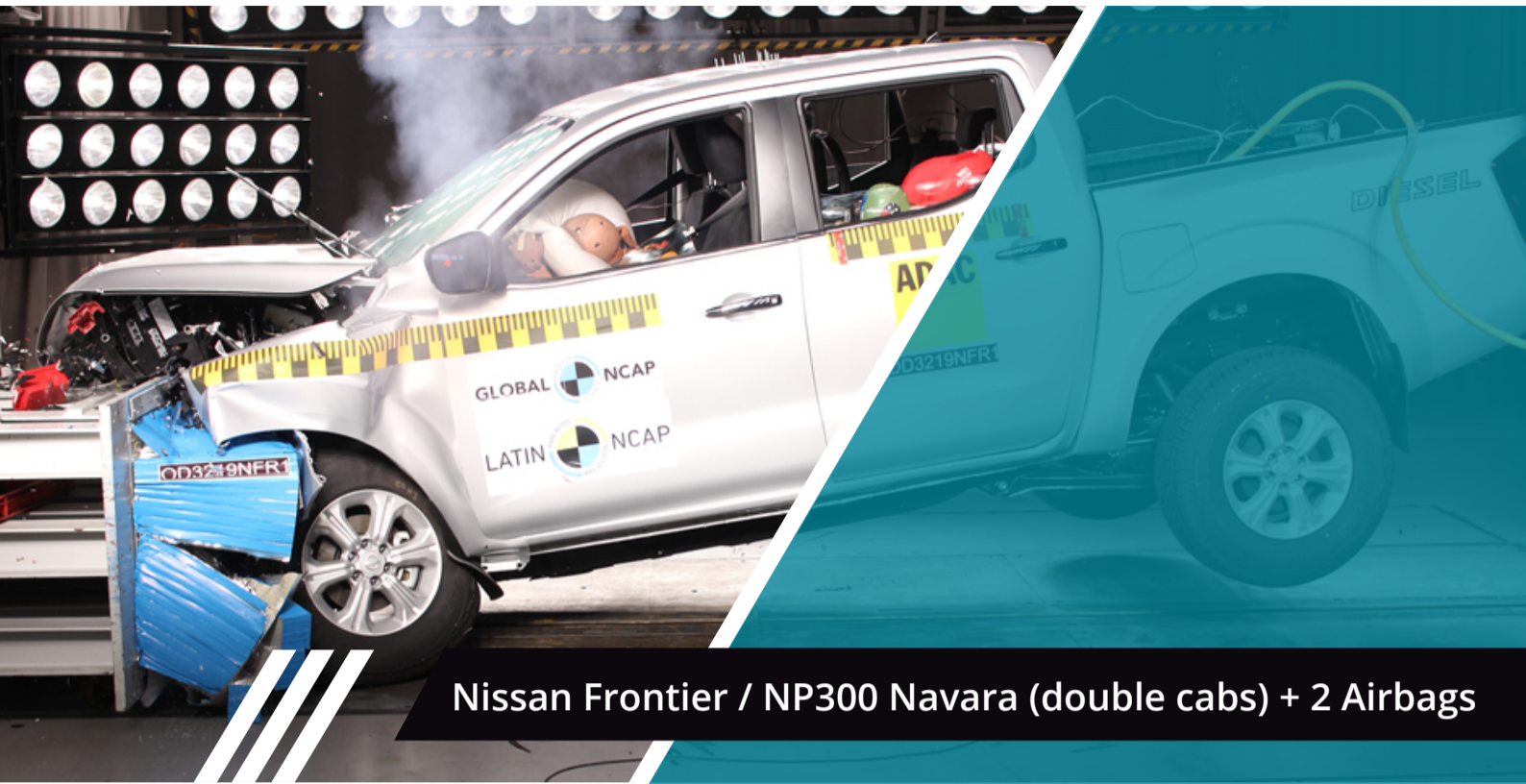
Nissan Frontier / NP300 Navara (double cabs) + 2 Airbags