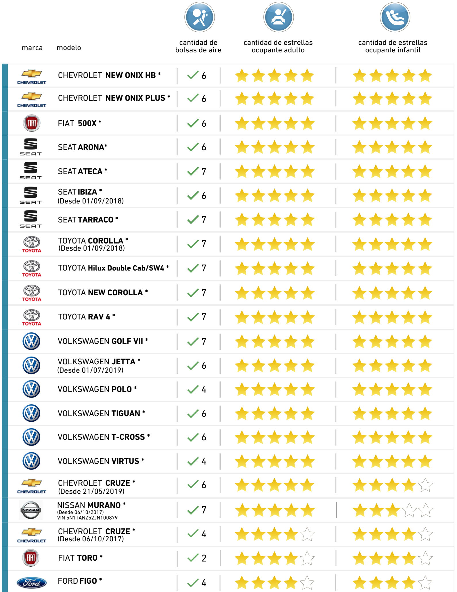
TABLA DE RESULTADOS 2019-2016